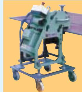
Ejemplos de: Chaflanado de piezas pequeñas multiformes. Examples of: Bevelling multi-form little parts. Exemples de: Chanfreinage de petites pièces multiformes.