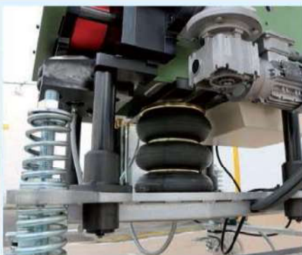
Sistema de elevación. Lifting system. Système de levée.