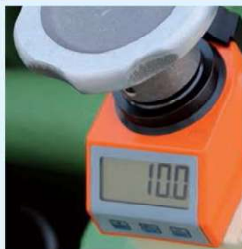
Indicador de posición electrónico. Electronic position indicator. Indicateur de position électronique.