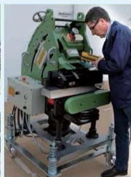
Manejable y fácil de transportar. Easy to use and transport. Facile d'utilisation et de transport.