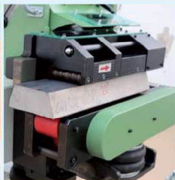
Sistema de fijación. Fixing system. Système de fixation.